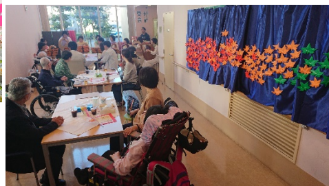
今年もいるレストラン 開催しました！ また来年もやります！