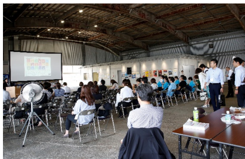
大かまでの「食べるを支える会」