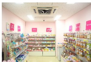
はつらつショップもよろしく！